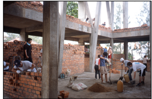
② 《ひろしまハウス（建設中）》2002年撮影

広島市の市民団体の依頼により、カンボジアのプノンペンのウナロム寺院内に作業所、宿舎となる建物を設計。募金活動をして、資金が溜まったらその分レンガを現地で調達し積み上げていく方法を取ったため、いつ完成するかわからないプロジェクトとなった。2007年に十年以上の歳月をかけた末に完成した。