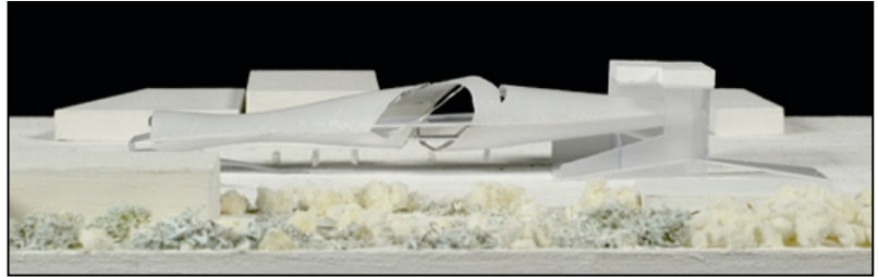
⑤ 《グアダハラ計画 メディアセンター 1/500 模型》 2008 年

メキシコ第二の都市グアダハラで 2011 年にパンアメリカン競技大会が行われることをきっかけに、全長 10km におよぶ都市の軸線のリニューアルを提案。国立公文書図書館を改築し及びメディアセンター、ツーリストインフォメーションを設計